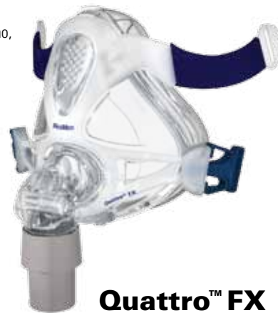
Quattro™ FX FULL FACE MASK

Il sofisticato cuscinetto Spring Air distribuisce la pressione in modo uniforme e assorbe anche i movimenti più minimi, consentendo all'utente di dormire con tranquillità senza temere che la maschera perda la sua tenuta.